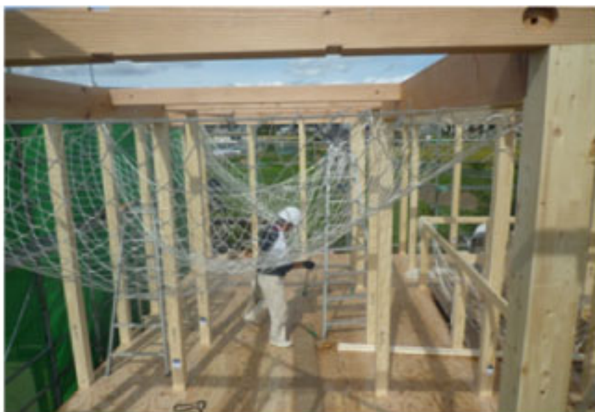
2012年10月 上棟 転落防止のための安全ネット