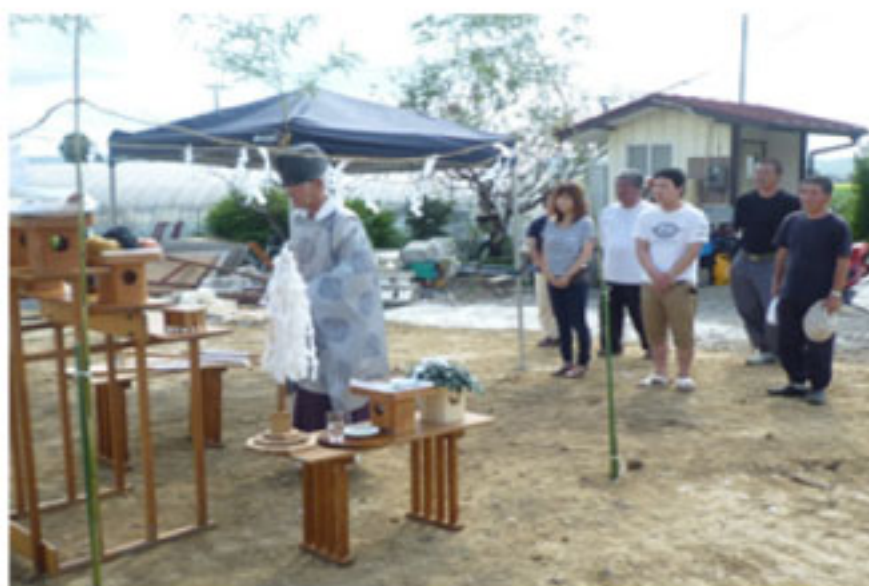
2012年 9月吉日 地鎮祭 (登米市)