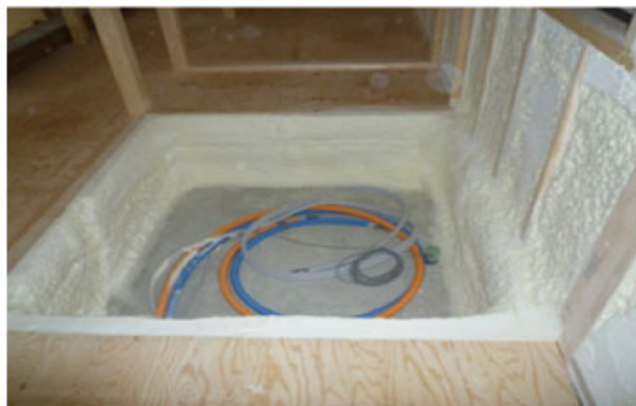
ユニットバス 下廻断熱工事