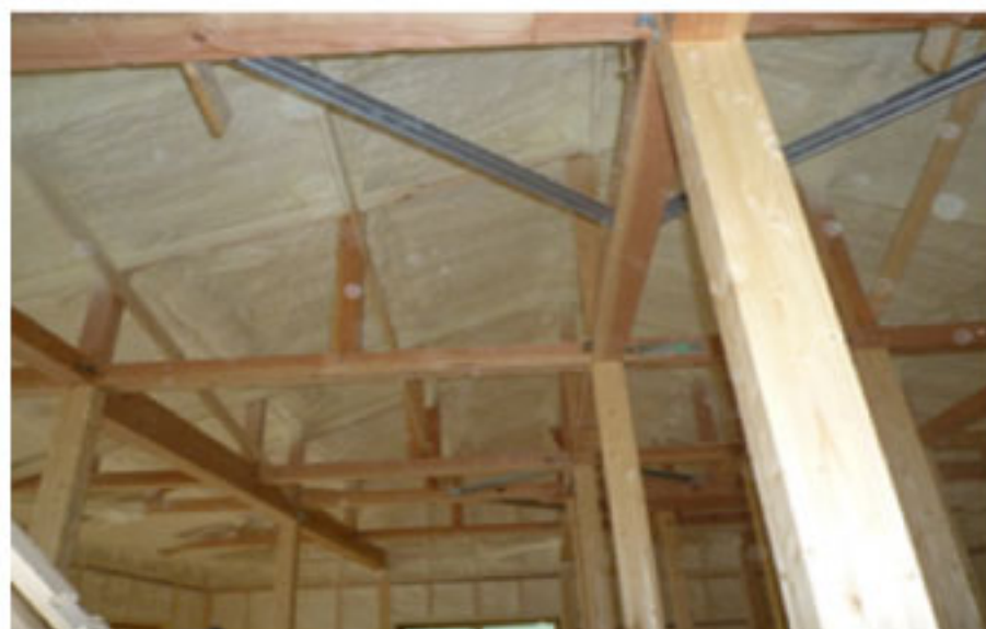
断熱工事 (現場ウレタン発泡) www.foamlite.jp