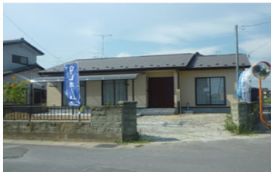
2012 8月竣工 (東松島市)